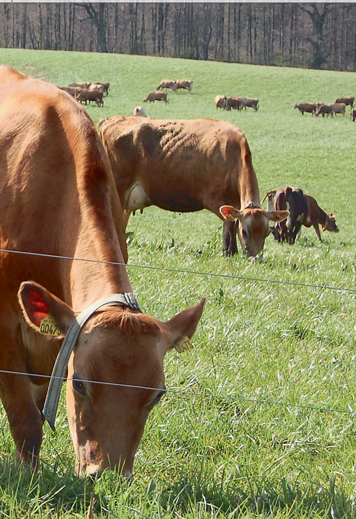
Der er en klar sammenhæng mellem høj ydelse og et godt dækningsbidrag for både økologiske og konventionelle besætninger.

et godt dækningsbidrag for både økologiske og konventionelle besætninger (se figur 2). For konventionelle bedrifter, stor race, er der i gennemsnit knap 1.800 kg EKM i forskel på de 25 procent med de bedste dækningsbidrag og ned til de 25 procent bedrifter med det ringeste dækningsbidrag. Ydelsesforskellen forklarer størstedelen af forskellen i dækningsbidraget mellem de bedste og de ringeste bedrifter.